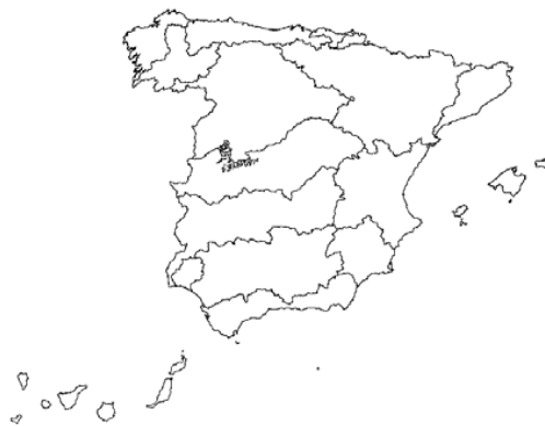
Tipo 24. Gargantas de Gredos-Béjar